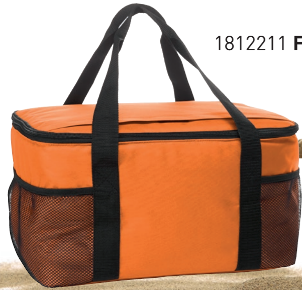
1812211 FAMILY XL

Der Name ist Programm – Denn hier geht eine ganze Menge rein. Die Kühltasche bietet ausreichend Platz, um Getränke kühl zu halten oder um einen Ausflug für die ganze Familie an den heimischen Badeseen zu organisieren. Die Netzfächer und das Einsteckfach bieten zudem weiteren Stauraum und die Tasche ist wie alle Kühltaschen natürlich food-grade.